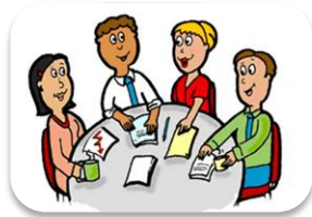
3. Ծնողական խորհուրդ