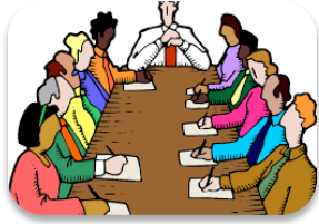
1. Կառավարման միացյալ խորհուրդ՝ 14 անդամ

Դպրոցում գործում են կառավարման և խորհրդակցական հետևյալ մարմինները՝