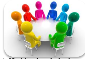
2. Մանկավարժական խորհուրդ