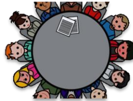
4. Աշակերտական խորհուրդ

Հիմք ընդունելով ՀՀ օրինակելի կանոնադրության դրույթները՝ բոլոր խորհրդակցական մարմինները պետք է մշակեն իրենց ներքին կանոնադրությունը, որը պետք է համապատասխանի դպրոցի և համայնքի պահանջներին և հնարավորություններին, և բխի աշակերտների շահերից: Ինքս կարևորում եմ բոլոր խորհուրդների ինքնավար գործունեությունը, իրենց գործողություններում ազատ լինելու հնարավորությունը: Խորհրդակցական մարմինների ճիշտ, դրական, անկողմնակալ և նվիրված աշխատանքի արդյունավետությունից է կախված դպրոցի ընդհանուր վարկանիշը: Աշխատանքների առավել արդյունավետ կազմակերպման համար նախատեսում եմ ստեղծել հոգաբարձուների և շրջանավարտների խորհուրդ: